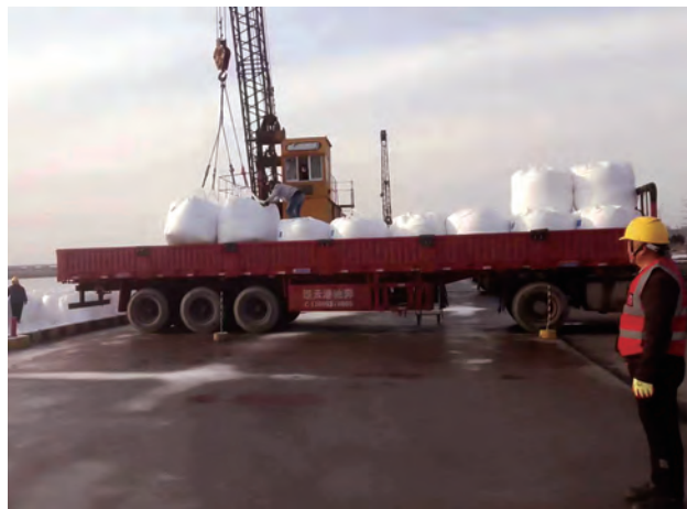
连日来,灌西宵洋物流公司广大员工克服风雪、低温、冰冻等不利因素坚守岗位,保安全、抓进度,高质量完成年度100万吨吞吐量任务,同时夯实来年码头高效生产基础。(胡秀同)

抢抓工程进度,强力推进项目建设。树牢“项目为王”理念,把项目牢牢地抓在手中,国际医药创新产业园抓住当前施工的大好时机,坚持施工质量与安全管理并重,项目在确保安全、质量的前提下,确保年内完成幕墙玻璃安装目标,把项目建设作为赛场,绘出热火朝天的“实干图”,跑出比学赶超的“加速度”,全力以赴完成序时进度。截止目前,医创园二期项目正在进行外墙幕墙、室内外装修及桥梁施工,全力推进项目建设目标。裕源二期项目部充分发挥“项目攻坚小组”作用,多举措扎实推进集团民生工程建设,目前项目已进入竣工验收阶段。(顾卫远)