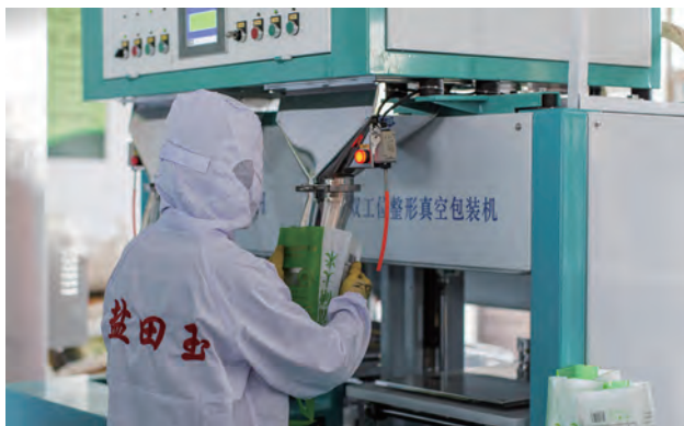
近日,青口米业营销中心抓住元旦节日期间大米销售高峰期,加班加点对大米进行加工生产,进行“线上线下”同步销售,做到送货上门和网络直播带货“两手抓”,让港城市民吃上新大米。(仲伟彬)