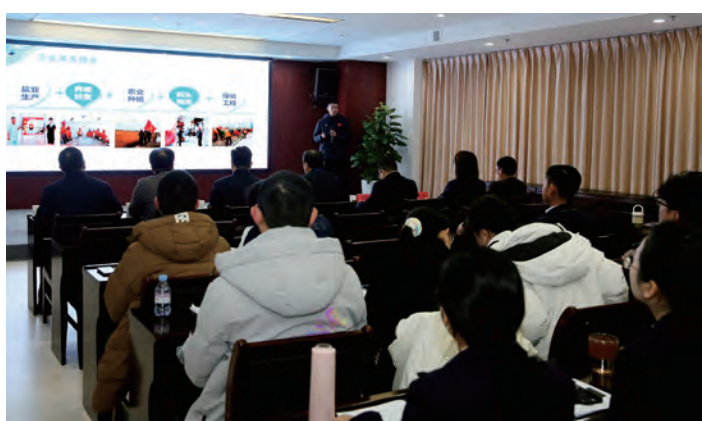
为进一步加强年轻人才综合管理能力提升,12 月 26 日,集团公司对近三年入职的 38 名年轻管理人员开展 2024 年度“调培生”遴选工作,本次遴选岗位为集团公司总部相关职能部门管理岗。下一步,将通过“专题培训、挂职锻炼、跟班学习、课题交办”等多种形式加大对年轻人才的培养教育。(工宣)

革故鼎新,“创”字开路,激发企业新动能。牢固树立“以科技为动力、以质量求发展、以创新谋发展”的理念,在突破传统中勇于探索,在发展壮大中不断创新,让创新成为企业高质量发展最大增量。通过不断实施产业结构调整和优化升级,全力推进企业同质化资源整合,实现由传统落后的粗放式生产向盐、养、农、物流、绿化保洁五大板块集约化生产方式转变。依托自身传统盐业和土地资源,以市场需求为导向,以增效降耗、低碳绿色为指引,致力于现代化日晒制盐建设,特别是滩涂水面资源、土地资源的创新创效利用,带来可观的经济效益、社会效益和环保效益。(许佃来)