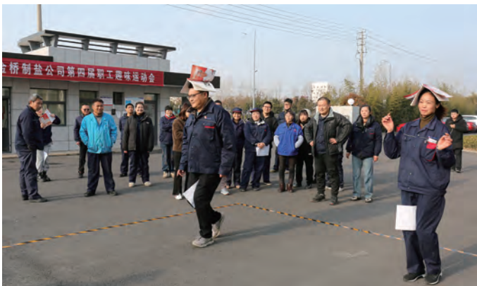
12月25日-28日,金桥制盐公司举办第四届职工趣味运动会,共设置知识搬运工等5项团体项目和象棋等6项个人项目。通过活动,既丰富了职工业余文化生活,又促进了团队合作意识养成。(谢杰)

技能竞赛与技术培训相结合,坚持竞赛过程管理与目标管理相结合,全力抓好项目部、生产车间、基层班组三级劳动竞赛管理工作,将竞赛向生产班组和营销系统延伸,将竞赛指标细化落实到岗位,将竞赛重心放在比安全、比技能、比指标、比效益等方面,构建了组织方式、竞赛评估、竞赛激励、竞赛保障相衔接的劳动竞赛工作体系。全年共组织各类劳动竞赛、技能比武竞赛8次,参与职工400余人次,进一步激发广大职工服务企业和经济高质量发展的创造活力。(顾卫远)