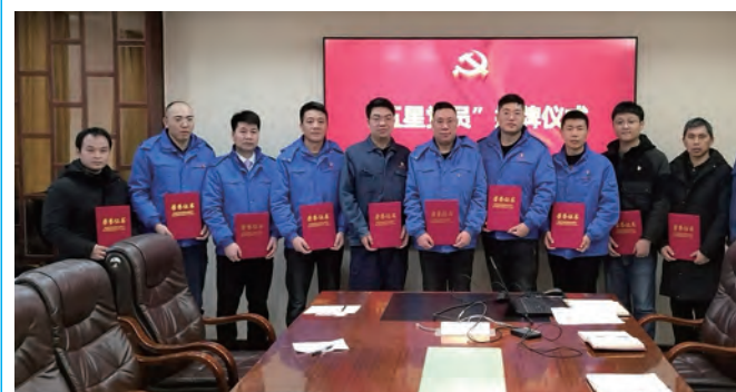
近日，利海化工公司党总支对评选出的10名“五星党员”（学习提高星、服务奉献星、爱岗敬业星、安全生产星、廉洁自律星）进行表彰、授牌，进一步激励全体党员挑重担、当标杆、做表率，推动各项工作提档升级。