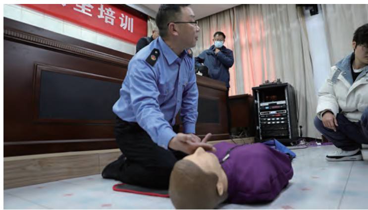
为进一步加强消防安全管理,提升消防安全意识和应急救援能力,12月12日,青口投资公司开展消防培训和疏散逃生演练,现场模拟办公楼突发火情,消防设备设施联动启动,各楼层疏散员有序组织人员紧急疏散。(陈琛)

稳健运营,为高质量发展赋能。坚持稳字当头,把“稳”作为工作总基调,深化年度经营指标共担的考核体系运行;全方位、多领域、深层次推动传统产业和服务新业的“两业”融合,紧盯效益提升抓落实,有力推动盐业生产、水稻种收、池塘经营、码头业务拓展、绿化保洁等重点性工作。截止目前,产盐60余万吨,销盐58万吨,超额完成生产任务;完成池塘收费5000万元以上、农田收费750万元;码头实现货物吞吐量100万吨;绿化保洁、市政服务全年实现收入1100万元。倾力改善民生,解决民之所盼,实现了一线职工工资增长的上调幅度、为在岗职工购买“江苏医保1号”等,加大了对弱势群体的帮扶力度,员工对企业的认同度越来越高。(许东彦)