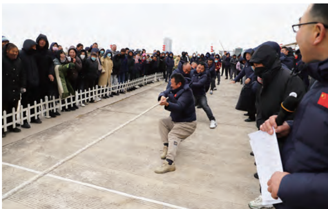
12 月 12 日上午，灌西投资公司举办第十一届职工文体周，来自各条战线的 600 余名职工参加了拔河、跳绳、趣味运动、象棋、乒乓球等比赛项目，进一步丰富职工工业余文化生活，增强职工凝聚力和向心力。(许东彦)