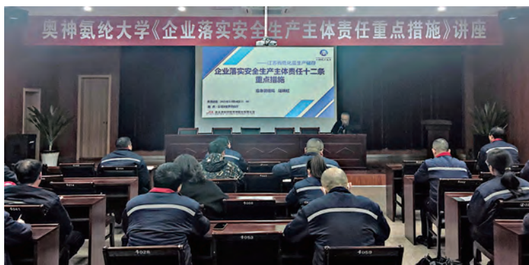
12月14日下午,氨纶公司2023级奥神职工大学第一课顺利开课。邀请市开发区应急管理局为学员作《企业落实安全生产主体责任重点措施》授课。(杨艳)

下一步,该所将严格落实常态化监管,合理安排电网运行方式,加强负荷监控和预测,切实做好特殊天气电网应急准备,为“迎峰度冬”充上“满格电”,为电力设备“强筋健骨”,确保供电万无一失。(张长晓)