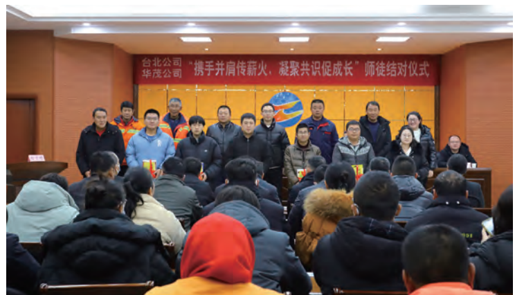
12 月 13 日，台北、华茂公司 20 对师徒举行拜师学艺仪式，师傅向徒弟赠送书籍并签订结对协议，通过“携手并肩传薪火，凝聚共识促成长”活动，进一步发挥公司中坚力量的传、帮、带作用，促进青年员工快速成长成才，打造一支“思想过硬、技术过硬、作风过硬”的技能型产业工人队伍。(北宣 北工)