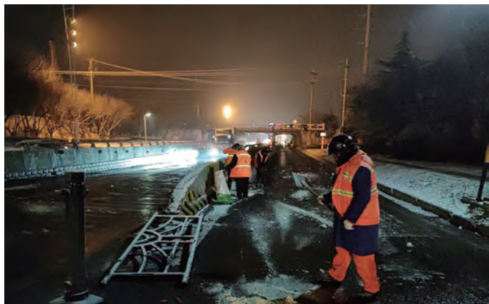
12 月 18 日晚至 19 日，集团各单位组织职工走上街道、社区、交通干道等公共区域挥锹铲雪，奋力除冰，全力保障交通安全。图为华茂环卫分公司职工连夜在开发区新光路涵洞清冰除雪。(工宣 北宣)