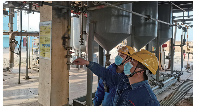
连日来,利海化工公司认真组织开展“事故隐患排查月”活动,列出问题清单,落实整改措施。目前已排查隐患 49 条,检查率 100%,整改率 100%。(林涛)