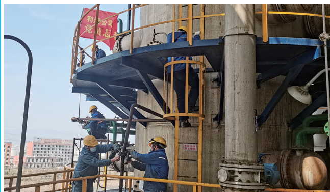
为进一步发挥疫情防控、复工复产中基层党组织战斗堡垒作用和党员先锋模范作用,利海化工公司党总支积极开展“党旗飘一线、战疫冲在前”主题实践活动,成立党员志愿服务队,组织党员冲在最前沿、干在最难处,为公司稳定生产提供可靠的组织保障。(顾孟 曹加余)